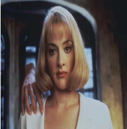
La veuve noire